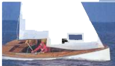
Amwind-PS satt: Mehrere Vorsegel stehen zur Auswahl

Es war einmal ein altes Sparschwein. Das war ganz aus Stahl gebaut und in Stadt und Land bekannt. Doch es war müde und langsam; ein neues, leichteres sollte her. So müsste die Geschichte vom Neubau einer sieben Meter langen Jolle vom Steinhuder Meer eigentlich beginnen, wäre sie ein Märchen. Sie ist aber kein Märchen: „Sparschwein“ heißt das ehrwürdige Vereinsboot des Akademischen Segler-Vereins zu